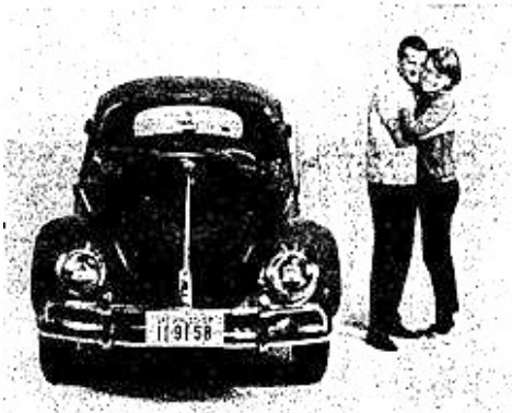
O VW dura

Por que o Volkswagen é tão procurado? Existem várias razões. Esta é uma delas: